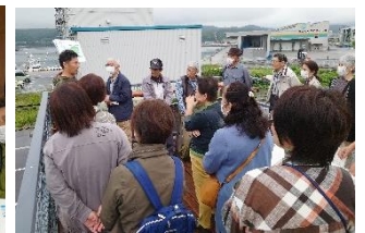
ワイナリー展望テラスにて