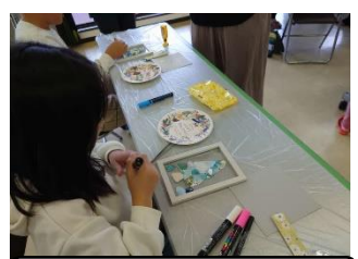
シーグラスアート体験