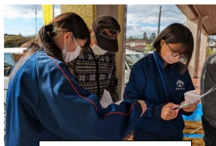
地域の皆さんとの交流