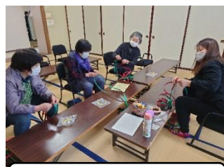
クラフトバンド体験