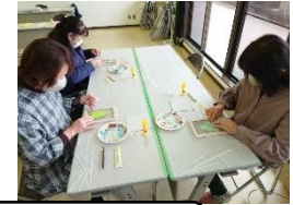
ご家族やお友だちと一緒に楽しい時間を過ごしていただきました