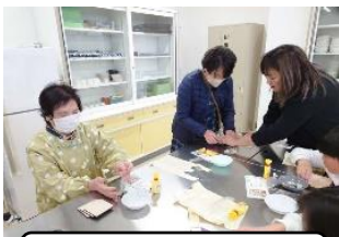
タイルアート体験