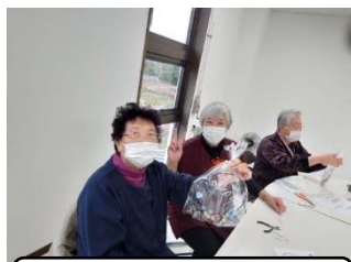
ワイヤーアート体験