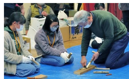
小刀を使って、きんこ作り