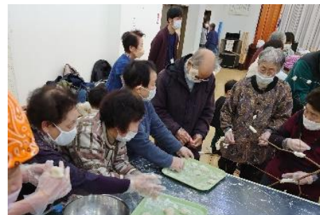
2区の皆様も餅切りのお手伝い