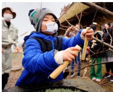
削った“きんこ”を栗の木へ