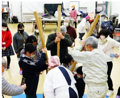
美味しいお餅になあれ

小正月行事開催のためにご尽力くださった正月かざり伝承会さんやひこばえの会さん、木材を提供してくださった皆様、ご参加いただいた皆様、ありがとうございました。