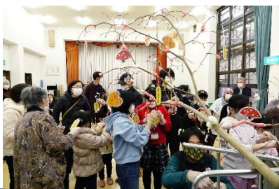
みんなで楽しく“まゆ玉ならし”