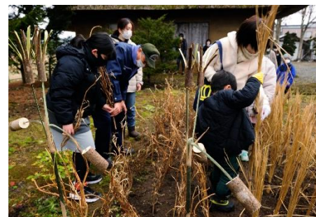
豊作を願って“おさくだて”