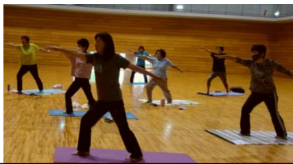
CMで見たことがあるポーズに挑戦