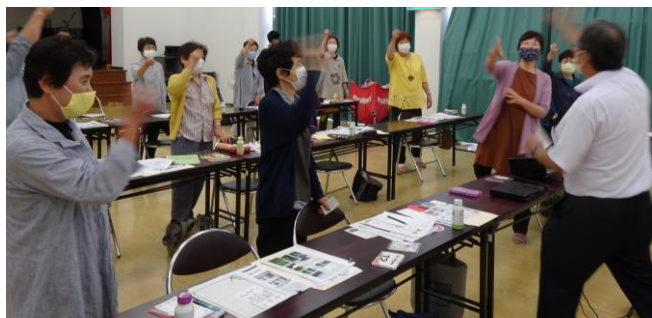
じゃんけん大会では素敵なプレゼントもありました

須川高原温泉までの国道を「リフレッシュロード R342」と名付け、樹木などの見どころを紹介するパンフレットを作成した奥野副支配人の「ここでしか聞けない」須川の魅力を、楽しくお話していただいた後は、じゃんけん大会や、オリジナル紙芝居「須川ものがたり」の上演など盛りだくさんでした。参加者のみなさんは「以前歩いて登ったことを思い出し懐かしかった」「地元のことを知る良い機会になった」と好評でした。